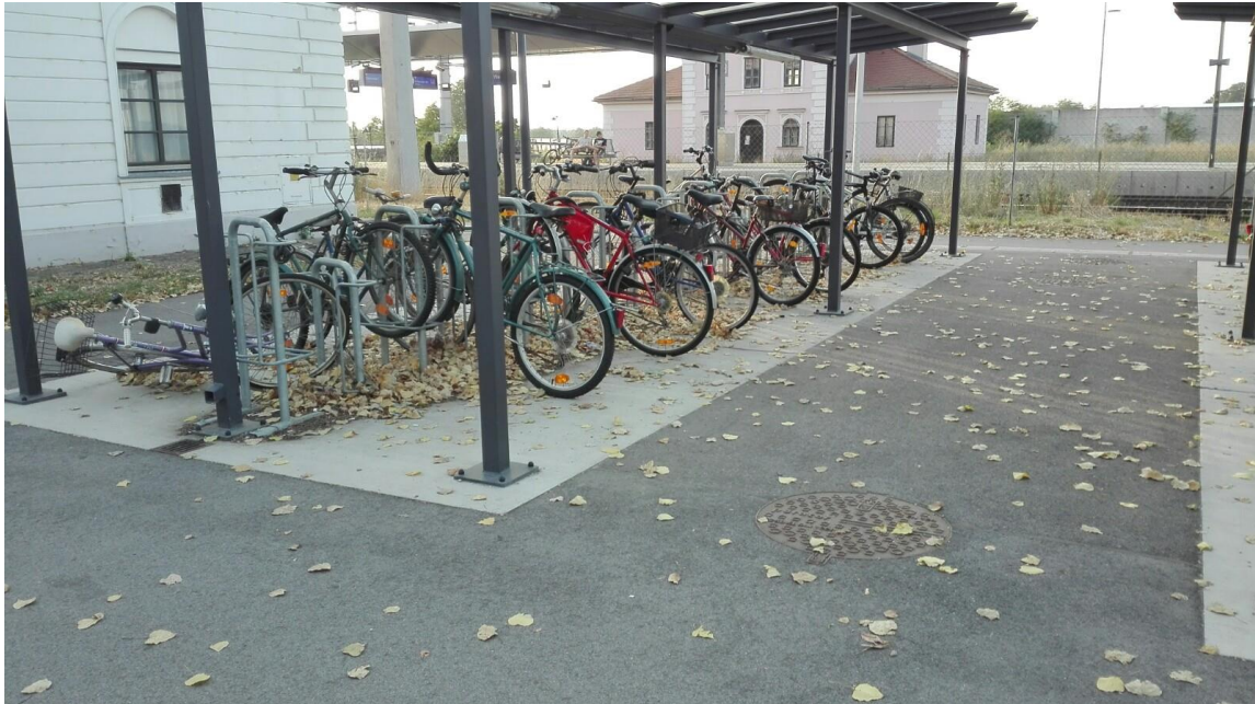
oberes Bild Juli 2017